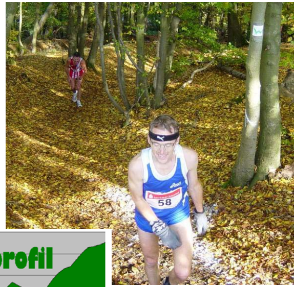
Im Ziel bei der Konkurrenz Geraune, Mensch haben die Blauen gute Laune!