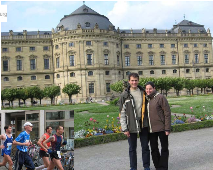
Hofgarten der Residenz (UNESCO-Weltkulturerbe)

Wilhelmshaven, Heilbronn, Schwarzenbek und eben auch Würzburg sowie um die Ecke in Luxemburg. Würzburg stand für MartinO auf dem Speiseplan. Mit Frau und „Kind“ ließ er sich von der Bundesbahn nach Würzburg bringen, um dann den Rest vor Ort, eben die 42